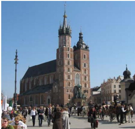
Marienkirche in Krakau